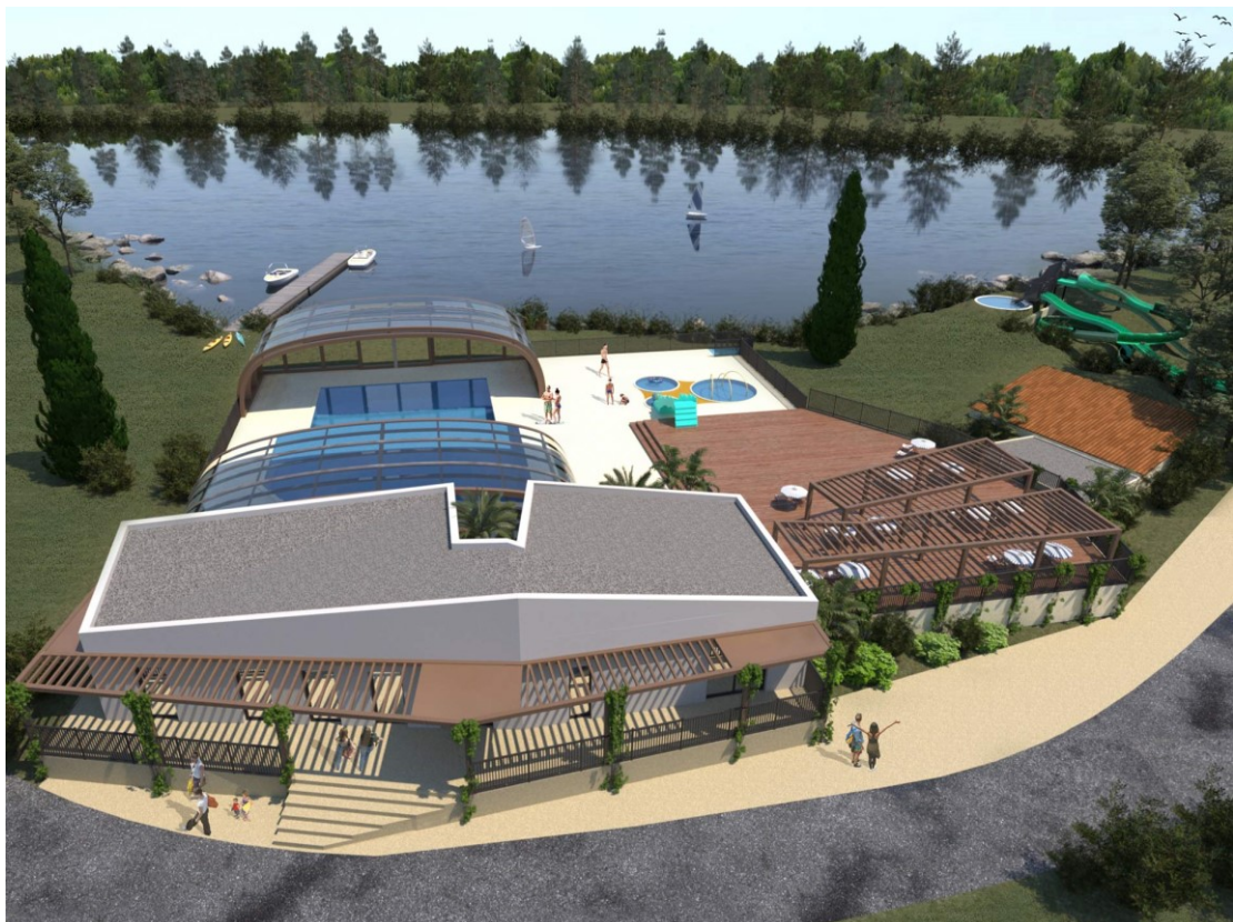
Yelloh! Village Douce Provence – L'espace aquatique avec toboggans et aire de jeux

Yelloh! Village – 7 chemin du Môle – 30220 Aigues Mortes – France