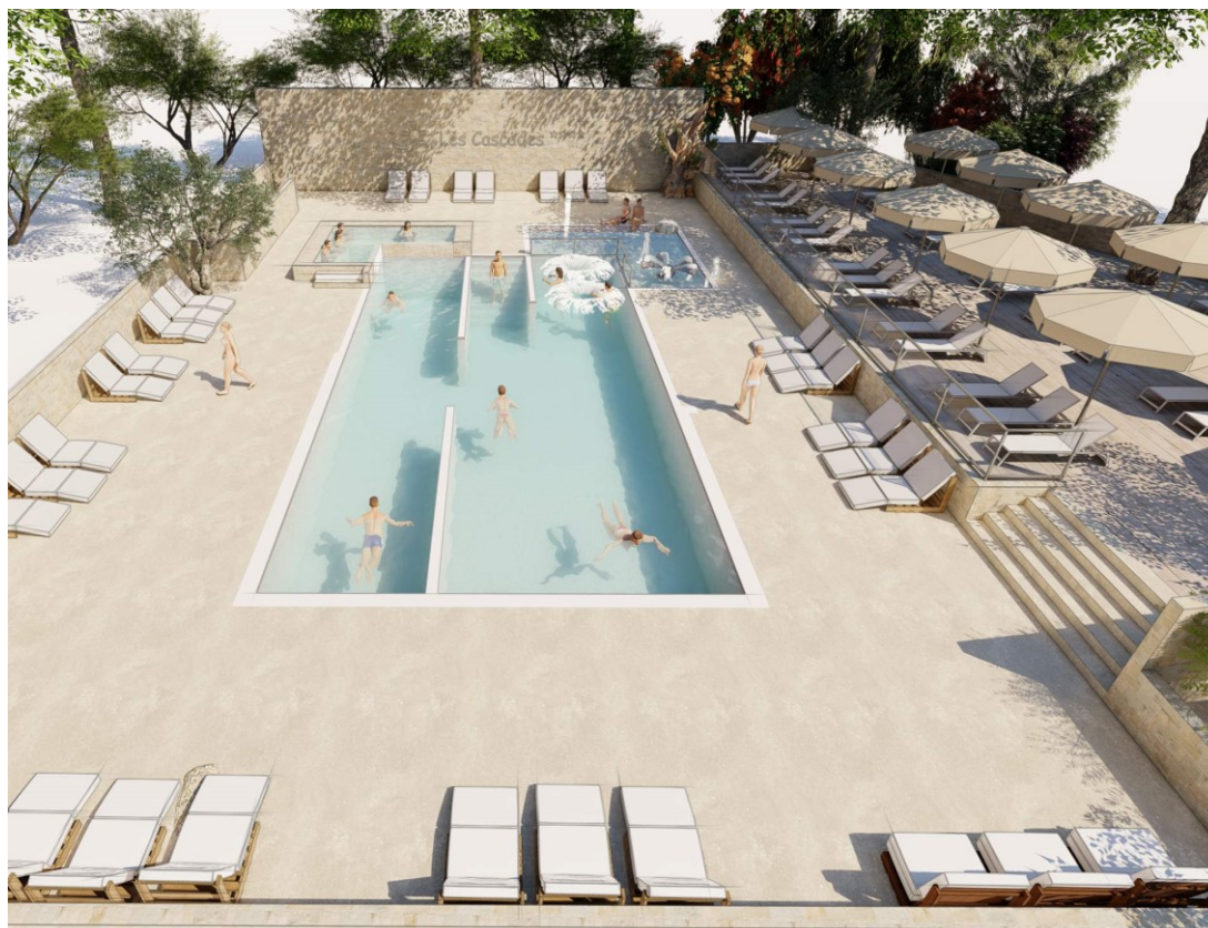
Yelloh! Village Les Cascades - Espace aquatique : piscine, pataugeoire, spa

Yelloh! Village - 7 chemin du Môle - 30220 Aigues Mortes - France Tel. +33 (0) 466 739 739 - http://www.yellohvillage.fr