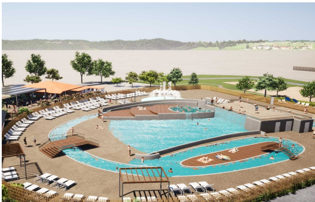
Yelloh! Village Médoc Océan - Espace aquatique : piscine à vagues, toboggans