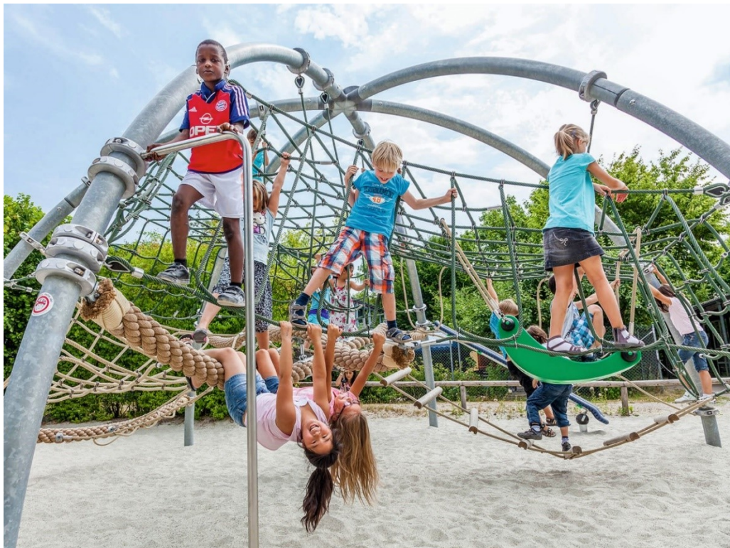
Yelloh! Village Mané Guernehué : jeux extérieurs pour les enfants avec filets, cordes et tubes