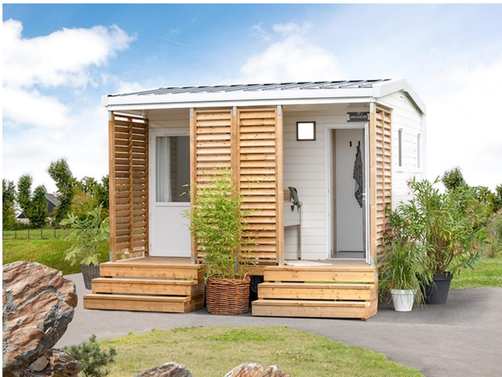
Yelloh! Village Les Rivages : nouveaux emplacements Premium avec sanitaires privés

Yelloh! Village - 7 chemin du Môle - 30220 Aigues Mortes - France Tel. +33 (0) 466 739 739 - http://www.yellohvillage.fr