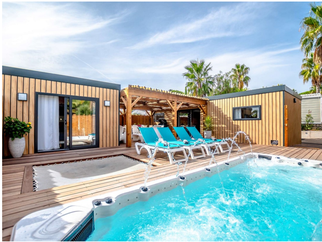
Yelloh! Village Domaine du Colombier : nouveau quartier Premium avec cottages équipés de spa