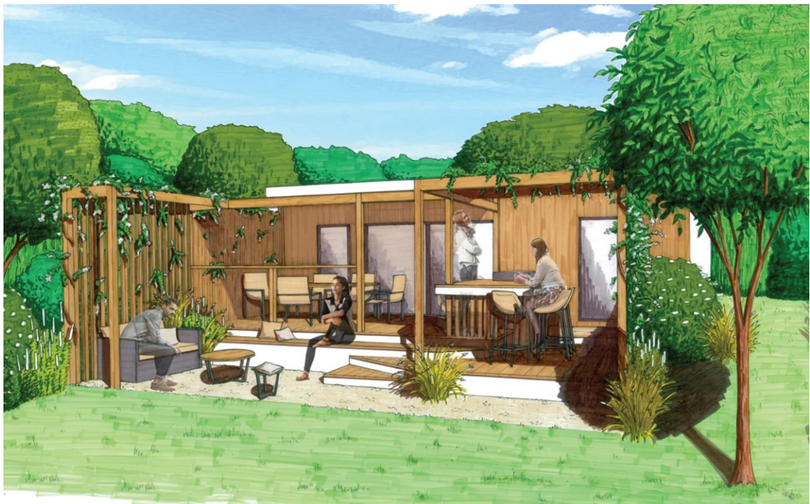
Yelloh! Village Les Voiles d'Anjou : installation d'un quartier Premium

Yelloh! Village - 7 chemin du Môle - 30220 Aigues Mortes - France Tel. +33 (0) 466 739 739 - http://www.yellohvillage.fr