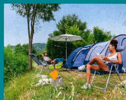
Yelloh! Village Soleil Vivarais (Ardèche).

Il en existe cinq superficies en fonction de la catégorie. Par exemple, la catégorie « 2 fleurs » : surfaces de 80 à 100 m 2 , avec électricité. Catégorie « 4 fleurs » : de 130 à 150 m 2 avec électricité, raccordement à l'eau et évacuation des eaux usées.