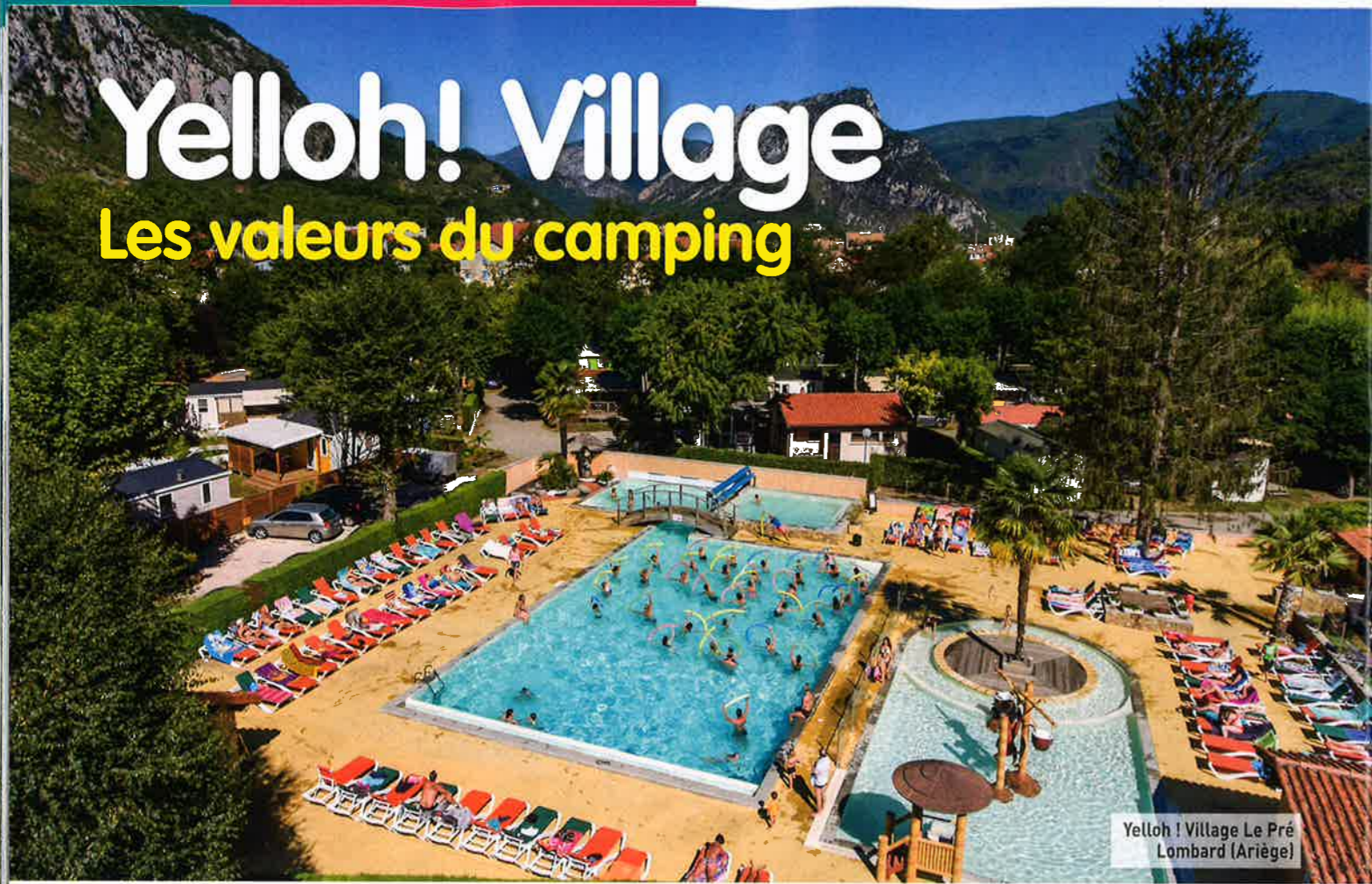
Yelloh! Village Le Pré Lombard (Ariège)

Ce qui est identique d'un Yelloh! Village à l'autre, ce n'est ni la décoration ni le paysagement. Mais leur haut niveau de qualité. Un impératif pour cette chaîne de campings indépendants, haut de gamme et exigeante. Pour preuve, 80% des terrains disposent d'une piscine chauffée. Deux positionnements distincts sont au programme de Yelloh! Village, ambiance « club » ou vacances « authentiques ».